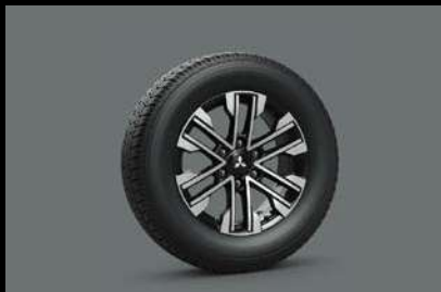
LLANTAS 265/60R18 CON RINES BITONO