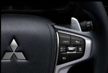
PADDLE SHIFTERS Manual de 8 velocidades

Diseño avanzado que se centra en la comodidad de conducción, la amplitud, la inteligencia y operación intuitiva.