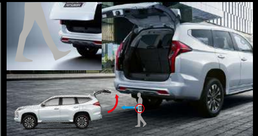
APERTURA ELÉCTRICA DEL PORTÓN POSTERIOR