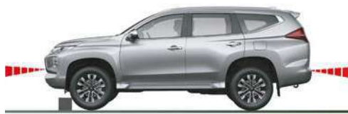
SISTEMA ULTRASÓNICO DE MITIGACIÓN DE ACCELERACIÓN POR ERROR (UMS)