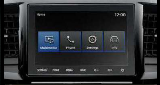
Radio de fábrica: Pantalla táctil de 8" Sistema de navegación, Android Auto / CarPlay, Control de voz y manos libres, AM/FM, HDMI (1), USB (2)