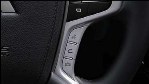
LINK SYSTEM Sistema de control de voz y manos libres.