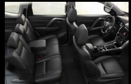
TAPICERÍA EN CUERO CON MANDO ELÉCTRICO EN LA SILLA DEL CONDUCTOR, CONSOLA DE PISO Y MATERIAL DEL TAPIZADO CON INSERTOS DE PVC