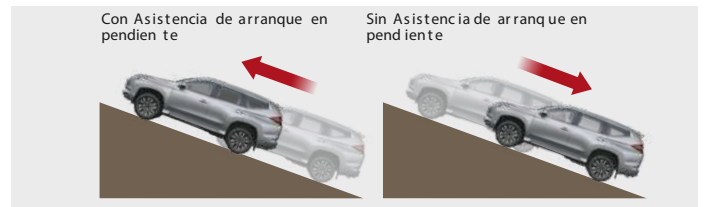
ASISTENCIA DE ARRANQUE EN PENDIENTE Ayuda a evitar que el vehículo se ruede hacia atrás mientras se libera el freno.