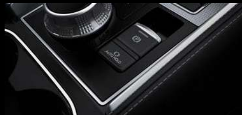
FRENO DE ESTACIONAMIENTO ELECTRÓNICO Y "AUTO HOLD"