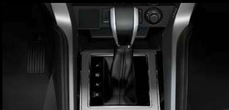
CAJA AUTOMÁTICA DCT (Dual-Clutch Transmission) y caja manual de 8 velocidades