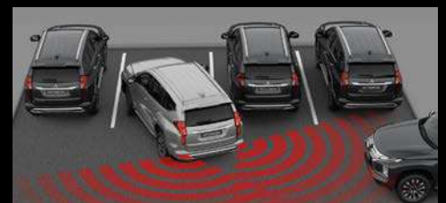
ALERTA DE TRÁFICO CRUZADO TRASERO [RCTA]