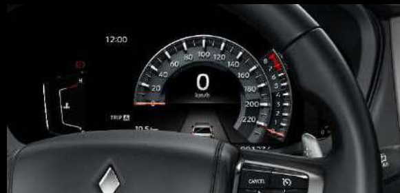
TABLERO DE INSTRUMENTOS DIGITAL DE 8" LCD A COLOR CON CONTROL EN EL VOLANTE