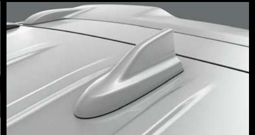
ANTENA DE ALETA DE TIBURÓN