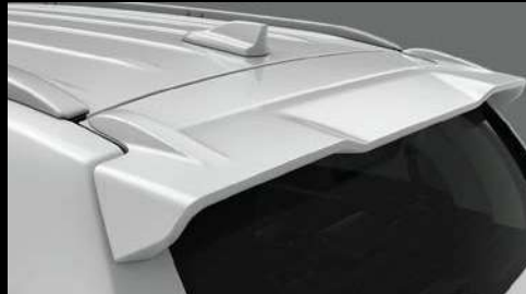
SPOILER DE TECHO