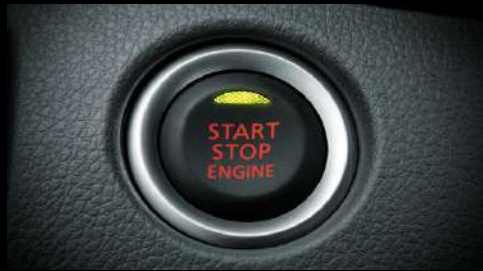
KEYLESS OPERATION SYSTEM Sistema de encendido y apagado con botón.