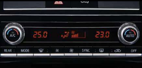
SISTEMA DE A/C CON FUNCIÓN DE LIMPIEZA DE AIRE (GENERADOR DE IONES) - PANASONIC NANOE™ II